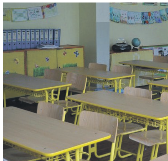
Na druhjostupňových školákov lavice ešte stále čakajú...